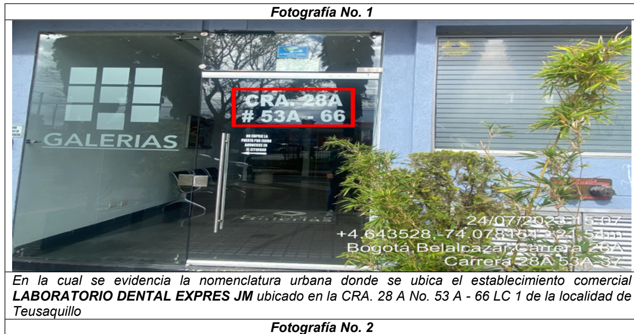
Fotografía No. 1